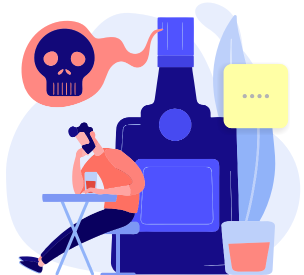
Perjalanan Jauh Untuk Mabuk-Mabukan