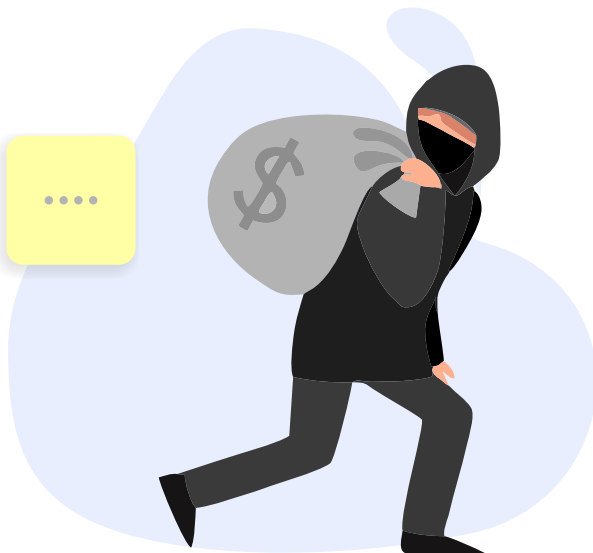
Perjalanan Jauh Untuk Mencuri