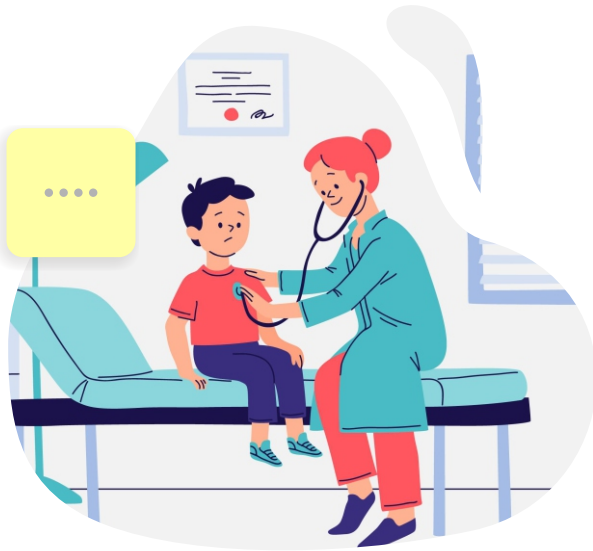
Perjalanan Jauh untuk ke Dokter